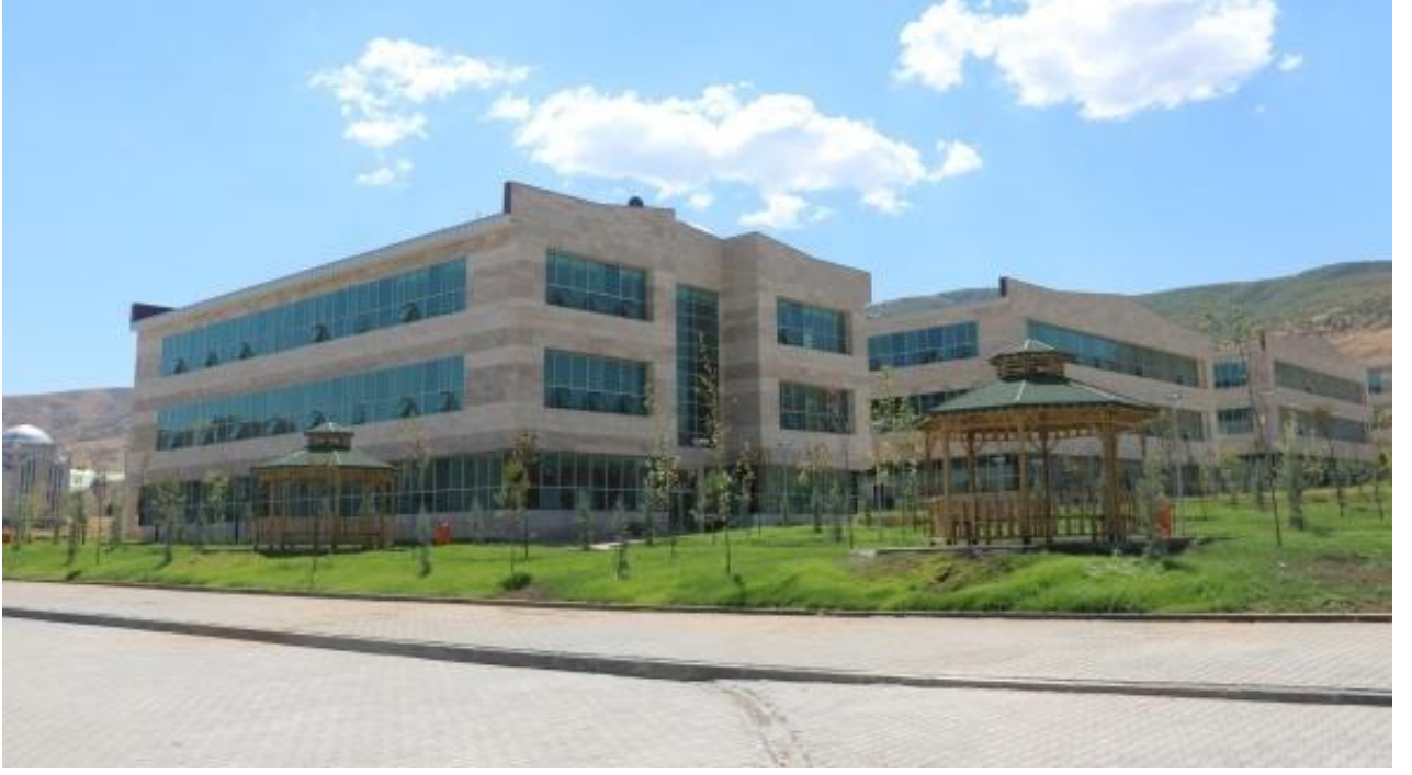
Resim 2 Fen Edebiyat Fakültesi 1'inci Etap

“Derslik ve Merkezi Birimler” projesine baęlı olarak; 2020 yılında ihalesi yeniden yapılan 14.000 m 2 kapalı alana sahip “İslami İlimler Fakültesi” yapım işinin, 2020 yılsonu itibariyle %43’ü tamamlanmıştır.