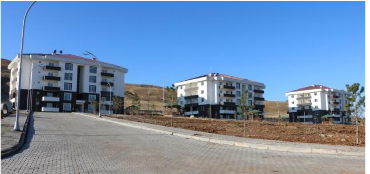
Resim 9 Lojman Yapım İşi (80 Daire)

2020 yılında yeniden ihale süreci tamamlanarak yapımına başlanılan “Lojman Yapım İşi (80 Daire)” projesi 2020 yılsonu itibari ile tamamlanmıştır.