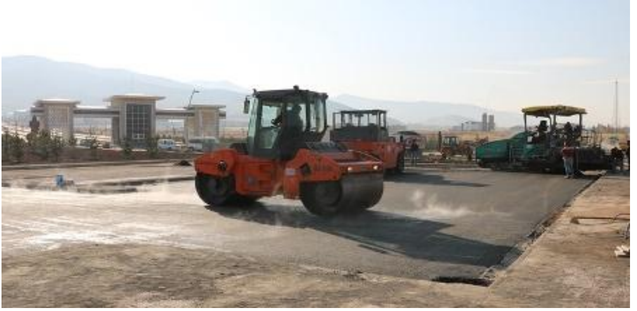
Resim 11 Nizamiye Asfalt Yapım İşi