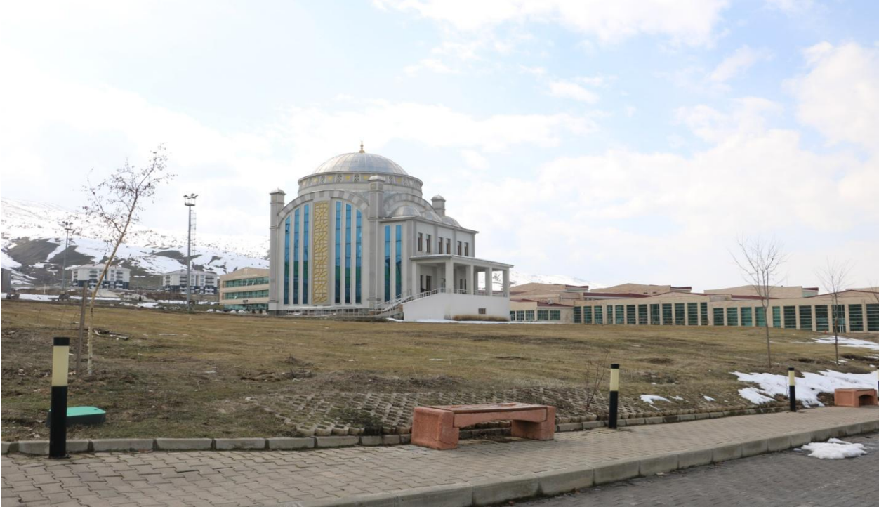
Resim 7 Gazze Cami

Muş Alparslan Üniversitesi Kalkındırma Vakfı tarafından yapımı üstlenilen Gazze Cami'sinin inşaat çalışmaları devam etmektedir.