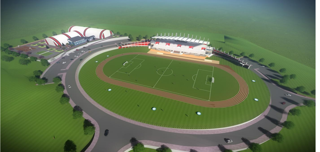
Resim 5 Açık Spor Tesisleri

"Açık ve Kapalı Spor Tesisleri" projesine bağlı olarak; 2020 yılında ihalesi yeniden yapılan 40.777 m 2 kapalı alana sahip "Açık Spor Tesisleri" yapım işinin 2020 yılsonu itibari ile %30'u tamamlanmıştır.