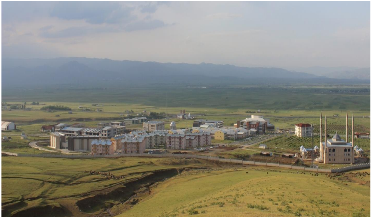
Resim 1 Merkez Külliye Alanı

“Kampüs Altyapısı” projesine bağlı olarak, 2020 yılında ihalesi yapılan “Muhtelif Altyapı” yapım işinin ve “Sondaj” yapım işinin 2020 yılsonu itibariyle % 100’ü tamamlanmıştır. “Kampüs Altyapısı” projesine bağlı olarak, 2019 yılında ihalesi yapılan "Nizamiye Asfalt" yapım işinin 2020 yılsonu itibariyle % 100’ü tamamlanmıştır.