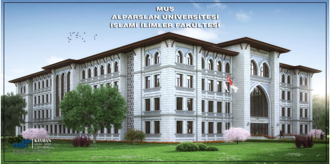
Resim 3 İslami İlimler Fakültesi

“Derslik ve Merkezi Birimler” projesine baęlı olarak; 2020 yılında ihalesi yeniden yapılan 14.000 m 2 kapalı alana sahip “İslami İlimler Fakültesi” yapım işinin, 2020 yılsonu itibariyle %43’ü tamamlanmıştır.