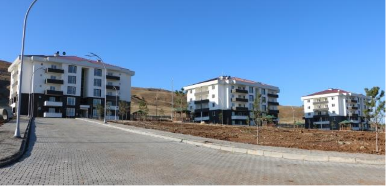
Resim 4 Lojmanlar ve Sosyal Tesisler